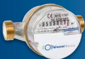
Bequem ablesen – ECO Wohnungswasserzähler