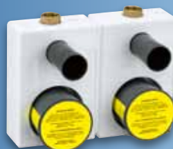
Problemlos einbauen – WG-TEC 3000 Montageblock

Innovative Wasserzähler und zuverlässige Lösungen für die Messtechnik