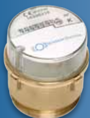
Intelligent austauschen – Unimeter ECO